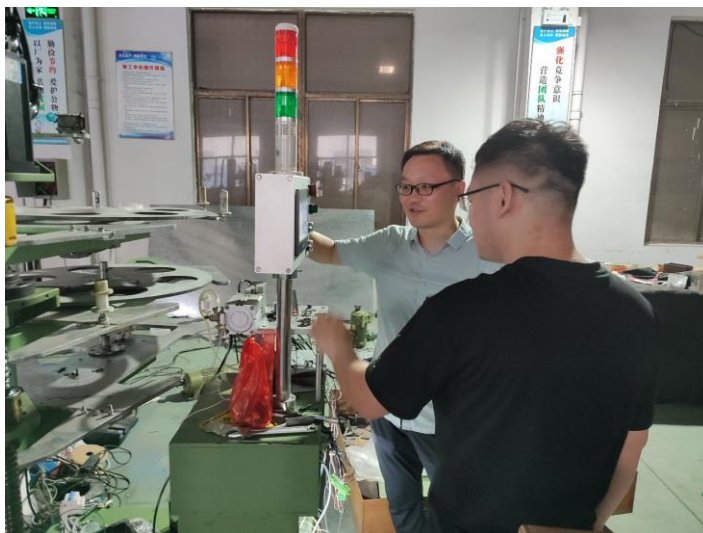
图 1 在淮安市创新自动化设备有限公司下企业锻炼教师

2023 年，淮安市创新自动化设备有限公司为江苏食品药品职业技术学院提供顶岗实习岗位 5 个，接纳多名学生完成为实践实习。接纳下企业实践教师 3 人，合作期间能够妥善安排教师们参与企业不同岗位的实践和学习，协助教师们完成针对人才培养方案中岗位能力需求的调查与调研任务。