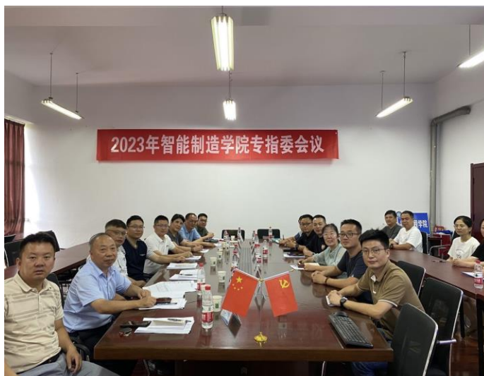
图3 淮安市创新自动化设备有限公司总经理参与讨论人才培养方案的修订