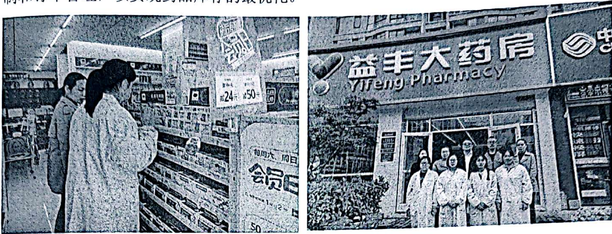
图 2 学生在药店顶岗实习

在药品库存管理环节，学生们学习了如何合理规划药品的进货和存储，如何保持药品的库存水平和保证药品的质量；了解了如何利用库存管理软件来进行库存控制和订单管理，以实现药品库存的最优化。