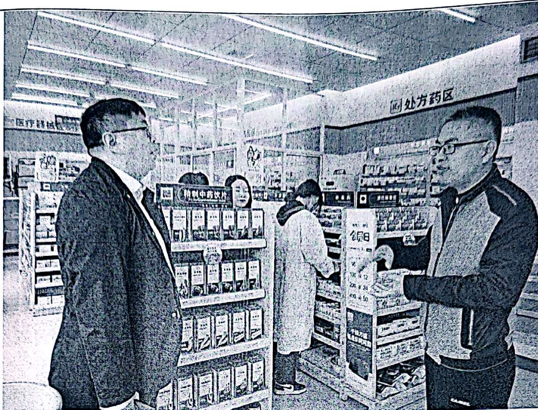
图3 教师在药店实践