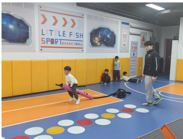
图3 学生在企业实习