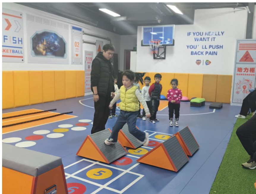
图2 邀请学校教师进行工作指导

学校派遣教师去企业参观学习,并聘请淮安市小鱼儿体育发展有限公司总监来校兼职授课。同时,企业也在开展一些活动时邀请学校教师进行工作指导。