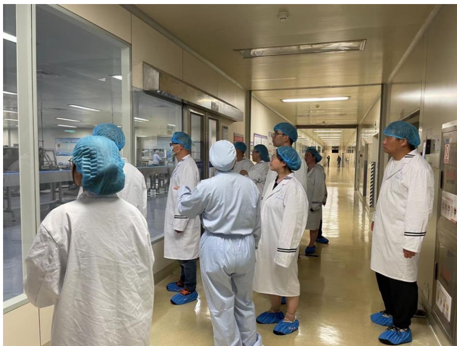
图 2. 学生参观江苏永安制药有限公司典型生产线