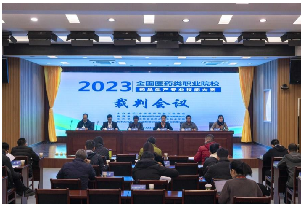
图 9. 公司为 2023 年全国医药类职业院校药品生产专业技能大赛提供技术指导

2023 年 11 月 17-20 日，在由中国医药设备工程协会主办、全国药品职业教育指导委员会指导、江苏食品药品职业技术学院承办的“2023 年全国医药类职业院校药品生产专业技能大赛”中，江苏永安制药有限公司为比赛提供了技术指导。