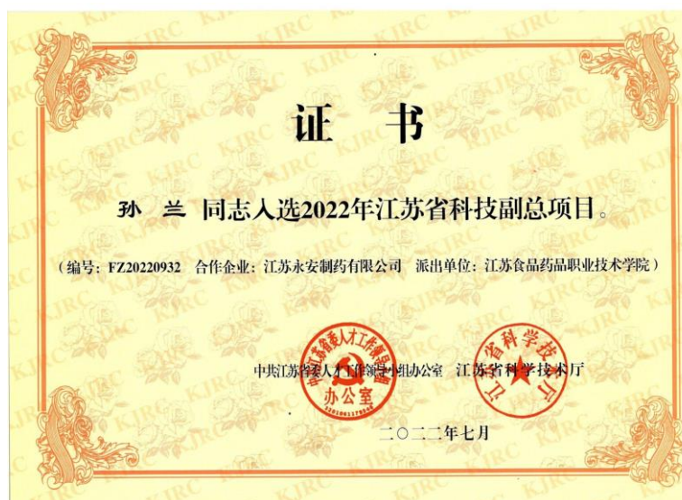
图 5. 企业与生物制药技术专业老师共同开展的横向课题入选 2022 年科技副总项目

2022 年，为进一步加强校企合作，实现产教融合，多方共赢，本着平等互惠、自愿诚信的原则，江苏永安制药有限公司与生物制药技术专业教师孙兰共同签订了一项 30 万元的横向合同，开展《八角枫抗慢性神经痛的药效学研究》。该项目已入选 2022 年江苏省科技副总项目，目前仍在进行中，企业提供专业的设备以及场地，孙兰老师提供技术支持。