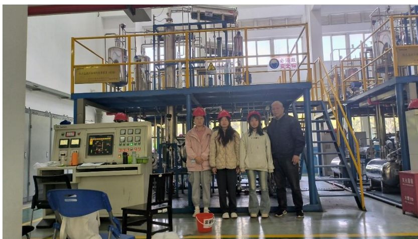
图 8. 公司为生物制药技术专业比赛项目提供认知实践机会

构建技能实训模块，逐年将生物制药专业新技术、专业新理念、比赛新规则融入技能实训方案中。然而比赛学生对于这些新技术、新理念缺乏直观与深刻的了解。通过与企业的深度合作与交流，很好地解决了上述问题。