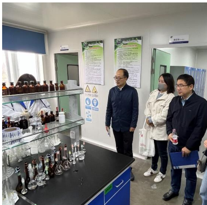
图 7. 江苏永安制药有限公司技术员指导生物制药技术专业教师下企业实践

江苏永安制药有限公司向生物制药技术专业提供企业师资力量，与教师所授科目精准对接，指导生物制药技术专业教师下厂实践，使老师们能从“理论-实践-理论”进行提升，对课程有了更深层次的研究和体会，对人才培养方案的修订、课程标准的制定、课程内容的选取、课堂教学的设计等都有非常大的启发与指导意义。