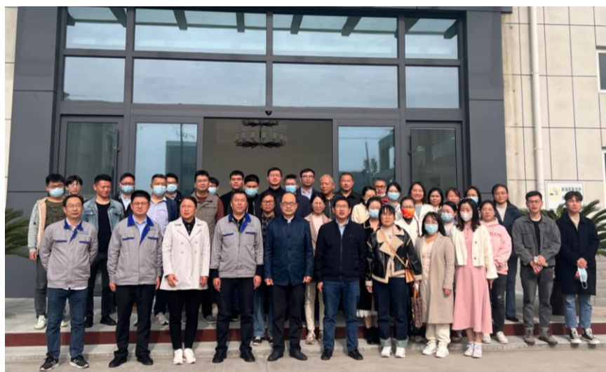
图 12. 参与生物制药技术专业研讨的人员合影

为提高人才培养质量，学校深入开展专业教学改革，狠抓内涵建设。坚持职业标准和人才培养标准对接，积极探索实施任务驱动、项目导向、案例教学等融“教、学、做”为一体的教学模式。生物制药技术专业与江苏永安制药有限公司合作，根据“按岗设课、因岗定学、因岗施教、设岗实训”的理念与思路，打造“工学交替”特色的课程体系。打破传统的专业课程体系，按照合作企业实际生产岗位需求，引入职业资格标准和行业技术规范，共同探讨课程设置，构建“基础理论+基本技能专业理论+专业技能核心理论+岗位技能”的“学校课程+企业课程”的课程体系。