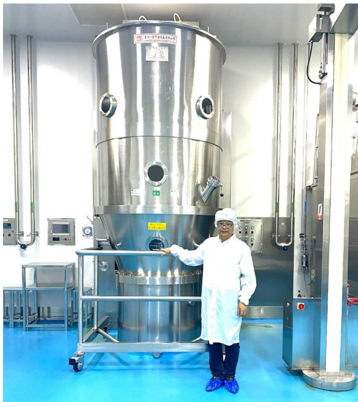
图 10. 教师与生物制药设备合影

和感性的认识。生动有趣的课堂演示往往会改变单调的课堂气氛，引起学生的兴趣与好奇心，增加了真实感，加深学生的印象。例如在《生物制药设备》课程中，教师将发酵设备以及某些发酵工业流程等内容从课堂搬进实验室和工厂，教师在真实的发酵设备前讲授该部分内容。从原来的平面教学发展到立体教学，可以让学生对原来生涩、枯燥、难懂的内容一目了然。