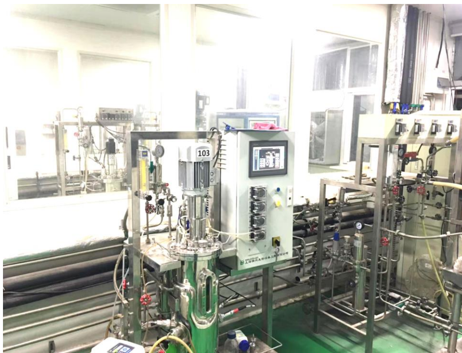
图 6. 企业与生物制药技术专业老师共同开展横向课题研究

江苏永安制药有限公司向生物制药技术专业提供企业师资力量，与教师所授科目精准对接，指导生物制药技术专业教师下厂实践，使老师们能从“理论-实践-理论”进行提升，对课程有了更深层次的研究和体会，对人才培养方案的修订、课程标准的制定、课程内容的选取、课堂教学的设计等都有非常大的启发与指导意义。