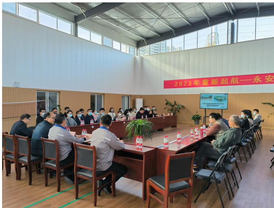
图 11. 生物制药技术专业与江苏永安制药有限公司共同探讨制定人才培养方案