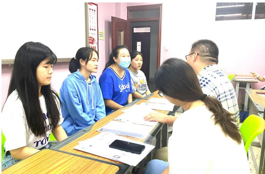
图 3. 企业技术员与生物制药技术专业老师交流

校企互聘共用的师资培养采用“一帮一”或“一帮多”的形式，企业技术员充当教师实践指导老师，为其提高实践技能；教师充当技术员工理论指导老师，为其提高专业理论水平。