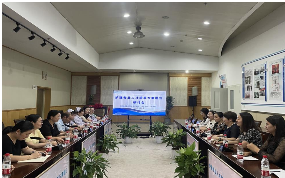
图 2 院校共同开展 2023 年护理专业人才培养方案修订研讨

2023 年护理专业人才培养修订工作期间，学校专任教师和我院医护人员共同开展职业能力标准调研，调研岗位能力要求，共同制订人才培养方案（图 2）。我院参与护理专业指导委员会会议（图 3），为培养目标、培养规格、课程设置等方面提供专业指导意见。