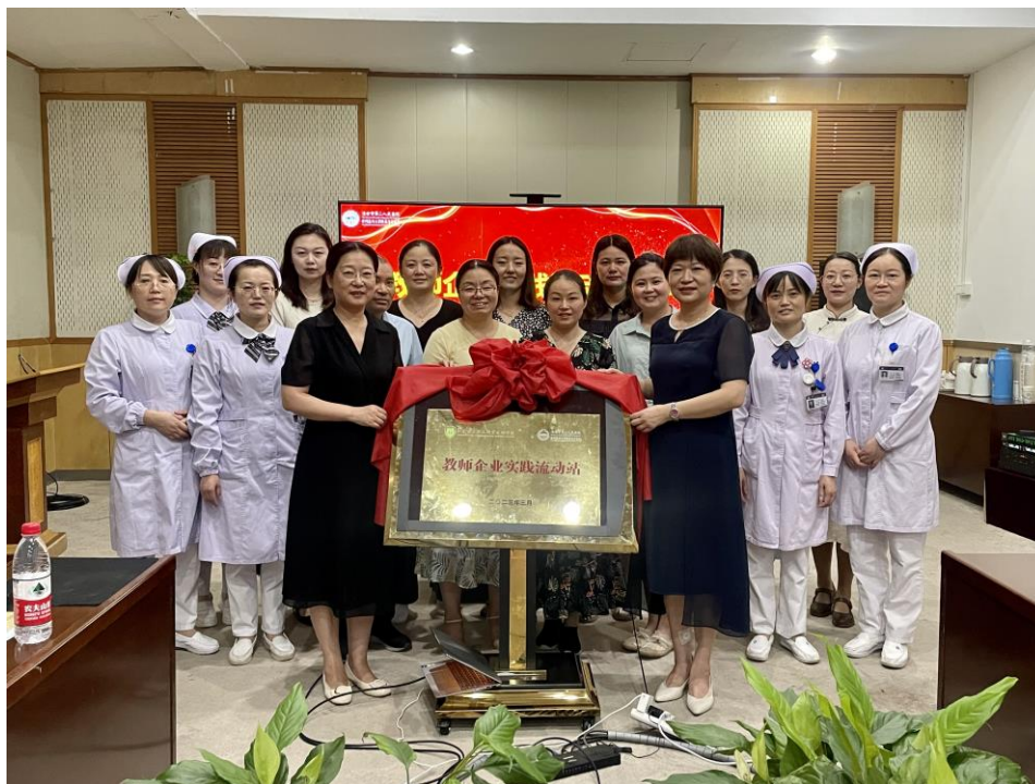
图6 教师企业实践流动站正式授牌

为提高教师的技能水平，护理学院每年8月份举办教师技能竞赛，我院护理专家承担评委，为教师的技能操作给予点评和指导。