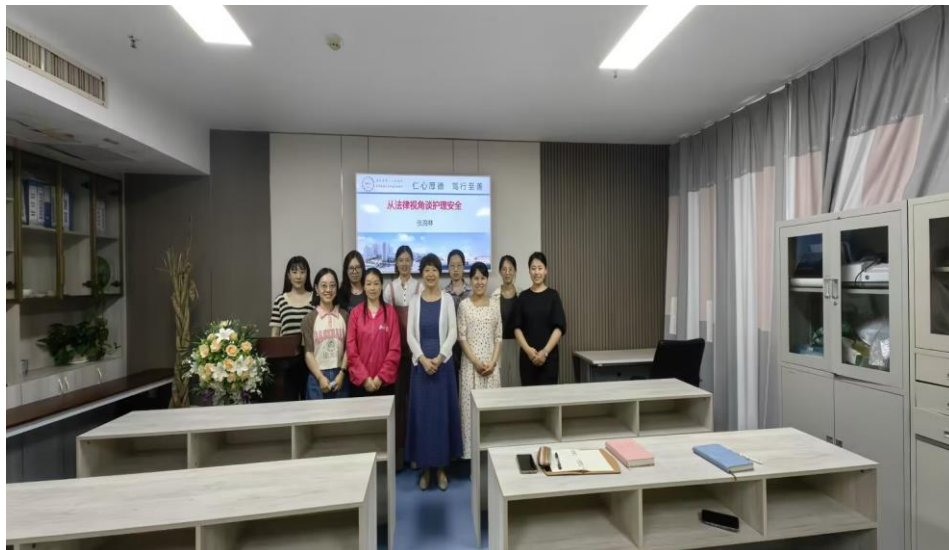
图7 专任教师暑期参与专科护士培训项目合影