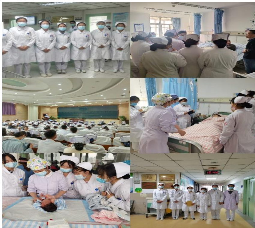
图 5 实习和见习剪影

座谈会，了解学生对实习的感受，全面了解学生的实习状态和生活心理状态，学生—医院双方实习满意度高。