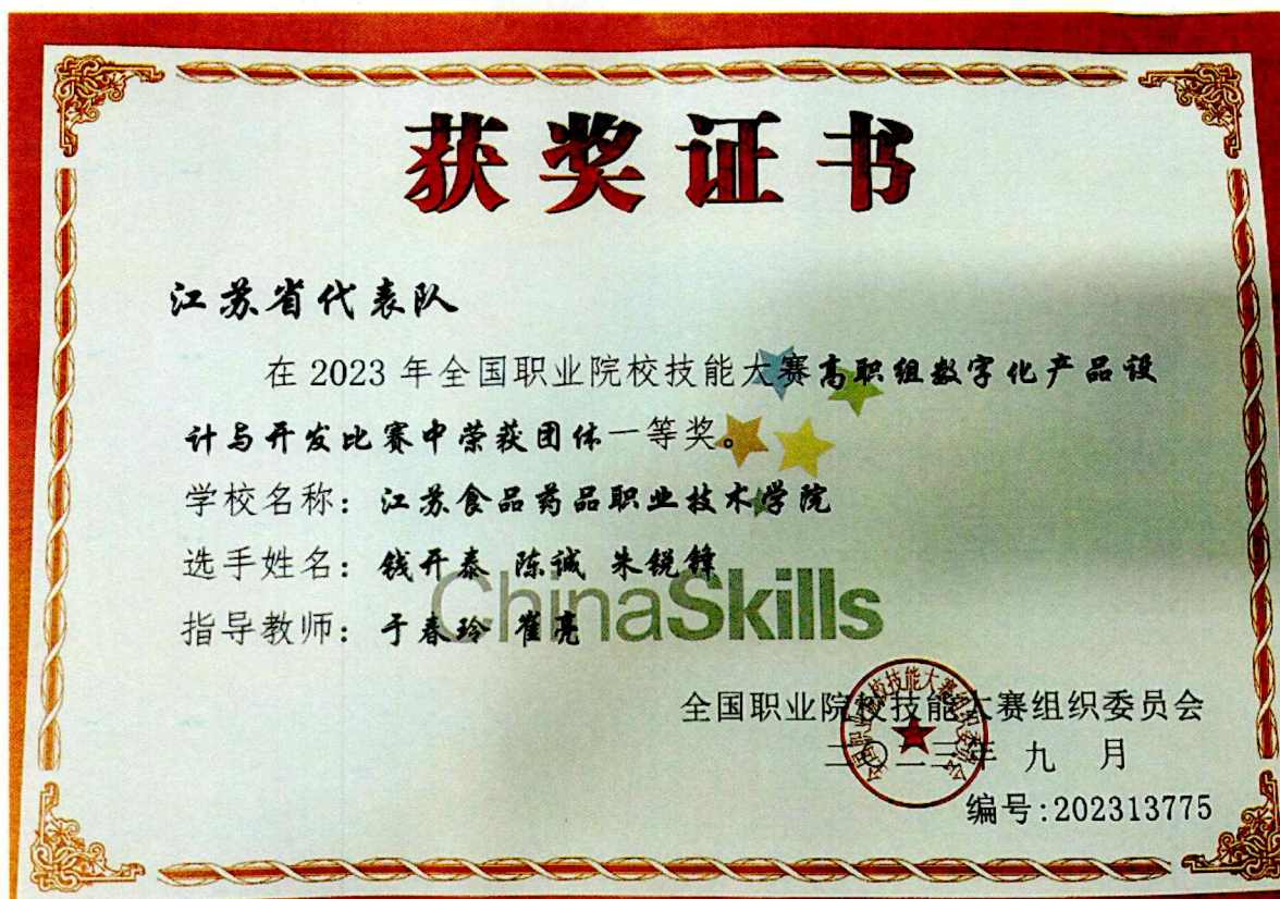
图 3 2023 年获全国职业院校技能大赛一等奖