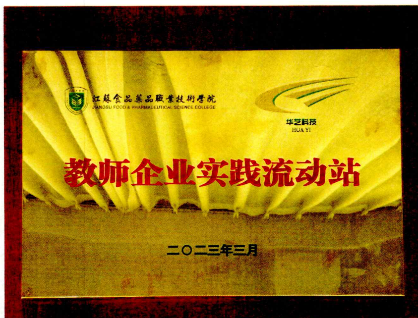
图1 校企共建教师企业流动工作站

江苏华艺网科公司以自身企业资源和行业优势，与学校合作共同建设学校首批教师工作站，为我院专任教师提供了一个真实、专业、可靠的企业实践学习平台，极大地提高我院相关专任教师的专业能力和教学实践能力，也为双方的深入而全面的合作开拓了更广的路径。2023年度学院共有10余名教师进入教师流动工作站进行企业实践锻炼，较好的提升了教师的实践能力和社会服务能力。