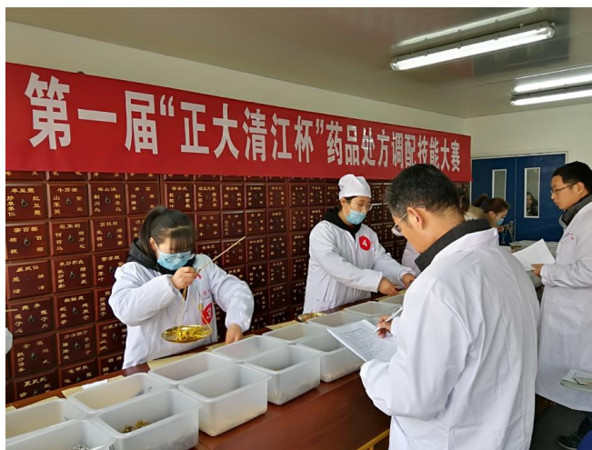
图6 “正大清江杯”药品处方调配技能大赛现场