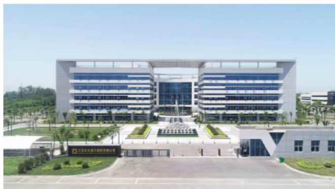
图 1 江苏正大清江制药有限公司外景

正大清江将以创新引领发展，担负“健康事业，美好人生”的使命，秉承公司“诚信、合作、共赢”的经营理念，以“激情、友爱、敬业、思变”的企业精神，为建设集研发、生产、销售于一体的大型现代化制药企业而不断奋斗！