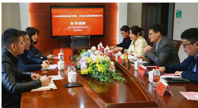
图2 校企合作洽谈会

此次洽谈会的顺利召开，拓宽了人才培养的平台与渠道，加强校企之间的强强联合，创造共赢新空间，对培养具有更符合市场、行业需求的制药人才起到了积极作用。