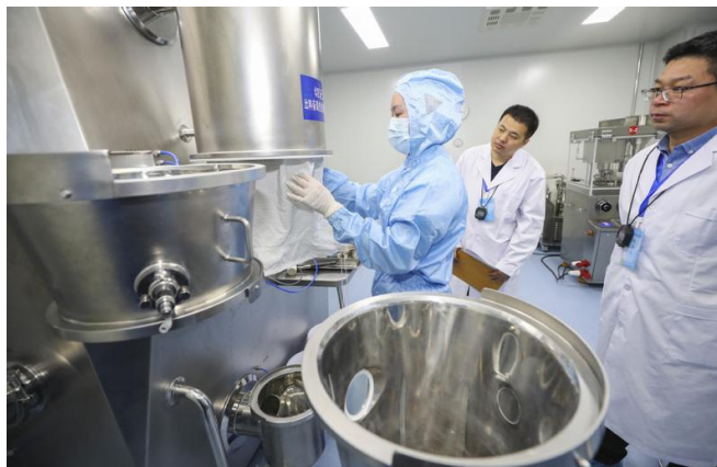
图 4 参赛选手正在进行制粒机操作