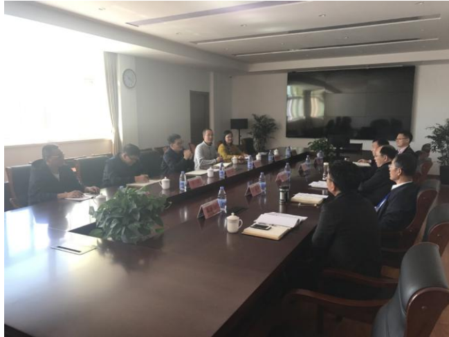
图9 学校代表赴企业考察交流现场