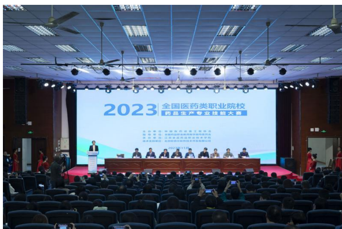
图3 全国医药类职业院校药品生产专业技能大赛开幕式

正大清江企业在整个大赛过程中提供了有力的技术支撑与物料保证，确保了大赛的圆满完成。