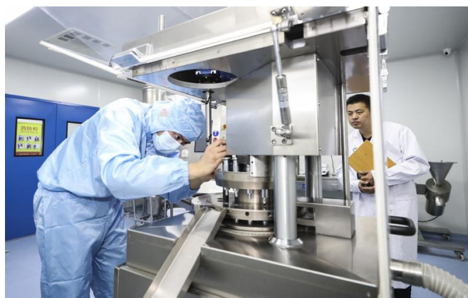
图 5 参赛选手正在进行压片机操作