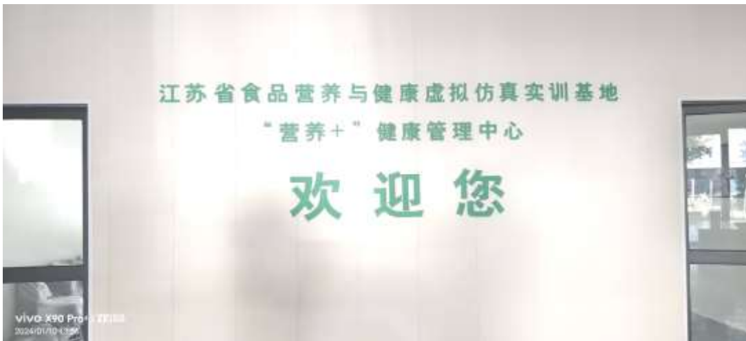
图5 “营养+”健康管理中心实体图