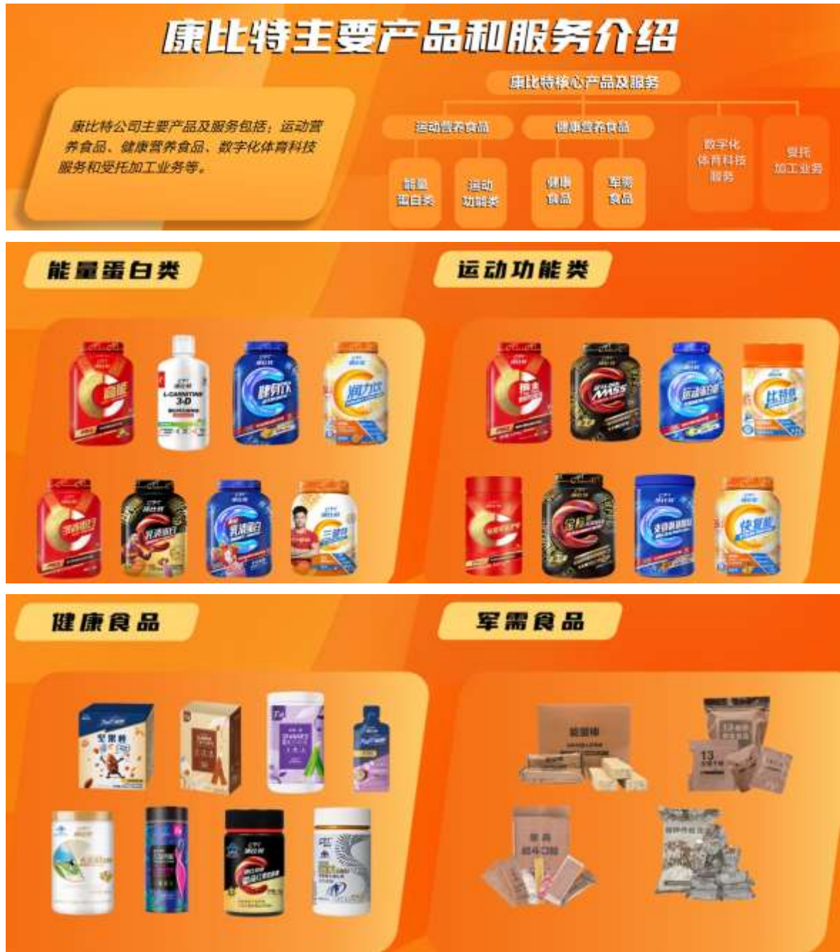
图1 公司主要产品及业务分布图