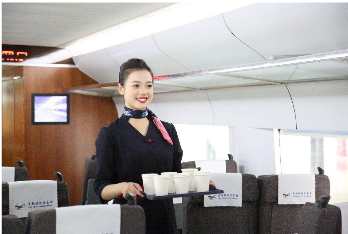
学生在高铁模拟舱情景模拟工作场景，开展项目式学习