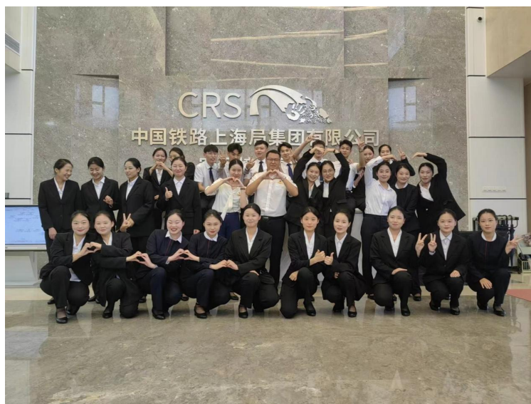
高速铁路客运服务专业学生在上海铁路局实习、工作

学生在第三年的实习实训过程中在中国铁路上海局集团上海客运段、南京客运段、合肥客运段、杭州客运段等校外实习基地进行为期三个月的岗前培训；校外实训基地和实训设备满足了高速铁路客运服务职业技能训练要求，接纳一定规模的学生实习；星铁航教育集团配备了相应数量的指导教师对学生实习进行指导和管理；有效保证了实习生日常工作、学习、生活的规章制度，有安全、保险保障。