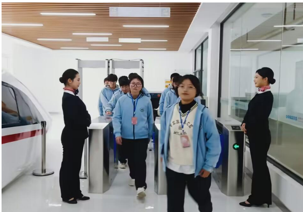
星铁航教育集团与我校共建的高铁服务模拟舱

星铁航教育集团与酒店学院共建高速铁路客运模拟舱，该舱综合了驾驶舱内部、一等座区域，卫生间区域、消防器材区域，茶水炉区域，门区、二等旅客区域、餐车吧台等部分在模拟舱内，学生可以完成绝大部分的专业实训课程的模拟。