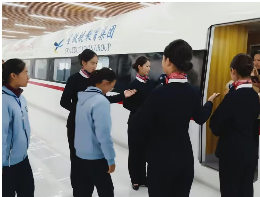
星铁航教育集团与我校共建的高铁服务模拟舱