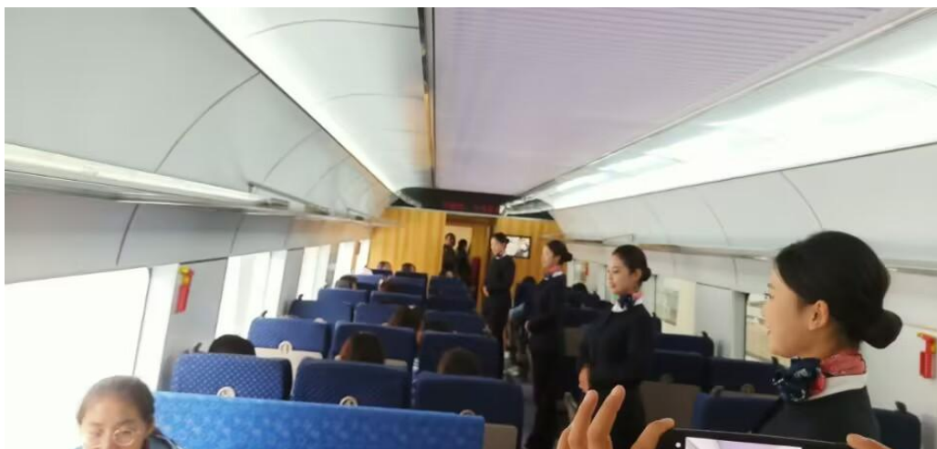
星铁航教育集团与我校共建的高铁服务模拟舱